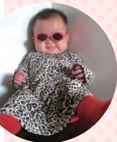
まーちゃん6カ月。下の歯 2本生えました！ 今夜も 眠らせないぜ！

在仏7年。バックパッカーでヨーロッパを周遊後、 ワーホリビザで渡仏し会社員に。現在は育児休暇を取 得して子育てに専念中。