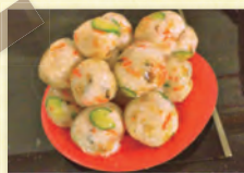
持っていったすし太郎手巻寿司。見た目が寿司じゃなくて評判イマイチでした。あれ、もしかして味が問題だったのかな……。