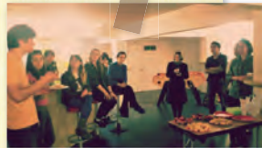
パーティ前に自分の持ってきた食べ物の説明をさせられました。お酒がなくて残念。

パーティ当日、私はすし太郎をラップで丸めた手巻寿司を持参。先生は「なぜ魚が乗ってないのか」と不満げです。「これはオニギリね!」それもちょっと違います。片言フランス語でうまく説明ができないので「これは桜の下でピクニックするとき食べる寿司だ」と(適当なことを)言うと「サクラ!サクラ!」嬉しそう。先生満足しました。フランス人に日本文化を説明するときはとりあえず 日本的なワードを散りばめれば乗り切れる 模様です。