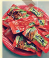
中国人のクラスメイトが持ってきた「鴨の舌」。配れども配れども、みんなどビって食べなかった可哀そうな一品。断りきれず食べたら骨々しい触感でした。